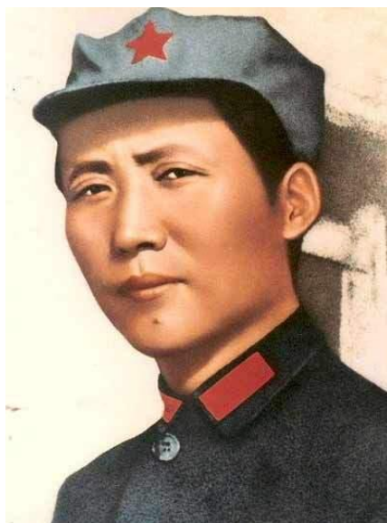
圖一：戴八角帽的毛澤東

在中共建政前，战争年代异常艰苦，中共军队一直面对着强大的敌人，需要做长期卓绝的斗争。囿于战时环境与条件的限制，彼时军队对于「穿衣戴帽」无暇顾及，只能因陋就简、将就应付，故而无法形成完整的军服体系，只能拿来主义，甚至一度穿过对手国民党军队的服装。1927 年，在后来被确定为中共建军节的南昌起义中，「红军」从国民革命军的营垒中脱胎而出，只能着对方的军服，仅加系红领巾以示区别。在同年的秋收起义中，参加者或着便服或着原国民革命军军服，仍系红布袖章以示区别。井冈山斗争时期，红军的服装没有统一的样式，主要依靠自带、自制、打土豪及战场缴获，全国各地红军的军服五花八门。1928 年，红军在江西宁冈县建立起第一个被服厂——桃寮被服厂，并开始设计生产军服。在款式上，参照当时苏联红军军服和列宁戴过的八角帽式样，形成了土地革命战争时期的基本款式，从此红军有了自己的制式服装：灰粗布中山装加缀平行四边形红领章、八角帽加缀布质红五星帽徽，打绑脚。中共军队从一开始就把象征着无产阶级解放全人类神圣使命的红色元素印在了自己的行装上，老红军杨光明回忆了参军时老同志的教导：「帽子上的红五星表示五大洲，我们不但要打倒中国的反动派，使全中国的穷苦人民有饭吃、有衣穿，还要实行世界大同」（杨光明，2006 年 10 月 23 日）。但总体上红军的供给十分困难，只够配备少数部队，绝大部分部队只能自己动手、土法上马。中共军队着装的改善始于抗日战争时期，为一致对外、抗击日军，国共再次合作，建立抗日统一战线，中共及其军队审时度势，红军主力和游击队分别改编为国民革命军第八路军（后改称第十八集团军）和新编第四军，服装则由被红军视为