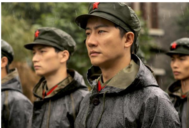
圖六：電影《芳華》劇照（主人公著 65 式軍服）

有助于重塑社会对于军人的理解和感知。曾几何时，社会价值取向日益多样，「最可爱的人」光环慢慢褪色，大陆军人社会地位、价值认同有所弱化，而新式军服则是对军人尊崇感的一种擦亮和刷新。