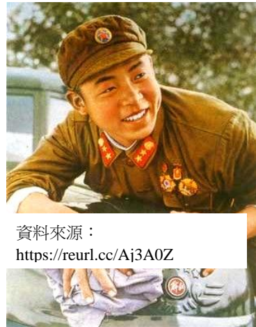
圖三：著 55 式軍服的雷鋒

中共极其重视政治建军。早在 1929 年，古田会议决议就指明中共军队的前身——中国红军是一个执行革命的政治任务的武装集团。而在长期的战争中，中共始终极其鲜明地反对单纯军事、雇佣的观点，强调中共军队的政治定位。根据这支军队的架构，除担负打仗的任务外，还担负做群众工作和生产的任务，既是战斗队，又是工作队、生产队；军人既是战士，更是人民的子弟兵、勤务员，是道德的楷模与社会的榜样。对于一名合格的战士来说，他所面临的敌人并不限于战场上的对手，还包括各种落后的、非无产阶级的思想。因此，军服具有很强的革命性质，必须表里如一地展示人民军队的形象。入伍参军就包含了对军人身体的挑选：谁可以穿上军服？建政之前，由于尚未取得执政地位，中共军队实行的是被称为「绝对自愿制」的志愿兵役制，「即加入人民军队者皆出于自愿，不计报酬，不确定服役期