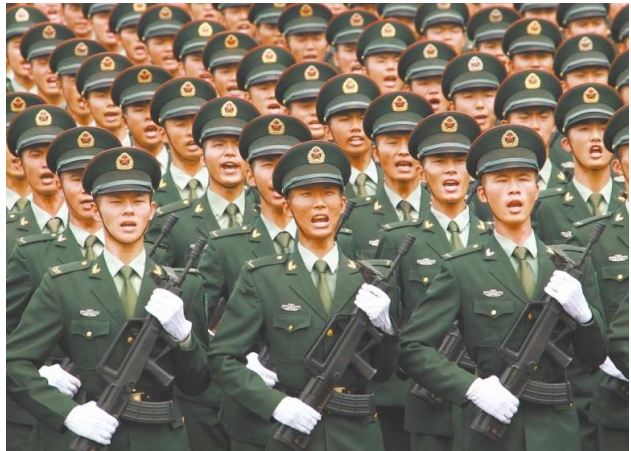
圖七：著 07 式軍服的軍人

作为世界上人数最多的武装集团，解放军被认为有着最坚定的政治信仰、最严密的组织纪律和最庄严的军队形象，军服则是这支军队特色与内涵的体现者、见证者。从建政前没有统一装束、「穿百家衣」到现在的完整、配套可与发达国家军队媲美，解放军服制的发展经历了从无到有、从有到全、从全到优的漫长过程。就解放军军人而言，军服不但是一种包装和遮蔽，更是一种规训与润色，通过其特有的方式定义了军人的身体，把每一名军人编织进中共军队这一庞大的组织系统中，形成了基于中共服制的政治秩序。而军服演变中的「变」与「常」所折射出的政治的、历史的乃至大众的逻辑又深深嵌入到军人穿衣戴帽这一再平常不过的行为中。中共军队坚持政治建军的原则，它申明自己并不是独立于政治的「国防军」，其政治使命即「人民的军队」、「中国共产党的绝对领导」、「保家卫国」这三者的统一始终不变，即使在着国民党军队军服时，其肃军容、壮军威的象征意义与观瞻功效亦丝毫不变，中共军队的革命本质和政治本色得以强调。同时，解放军又不断适应现代化与正规化的要求，按照面向世界与面向未来的愿景，与时俱进、不断创新，形成了具有大陆特色的现代军服体系。改革开放以来的军服，不断发展与完善，在功能、识别、形象诸方面皆有重大的突破，不但更加适应现代作战的要求，而且也顺应了国际军服改革的潮流，彰显了中共军队的形象、自信与底气。