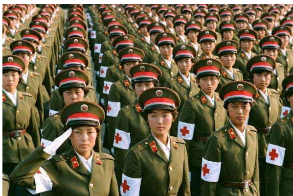
圖五：1984年閱兵時著85式軍服的女兵方隊

然而，这不但常常导致军人的疲惫不堪，而且使他们陷入道德绑架的尴尬境地——见义勇为固然值得倡导，但随着大陆警务力量的壮大和完善，人们逐渐习惯于由警察按照专业分工来处理社会治安与公共安全事件；另一方面，助人为乐、先人后己的要求常常使他们在公共场合无所适从，如乘公交车时有座不敢坐，面对「军人优先」的