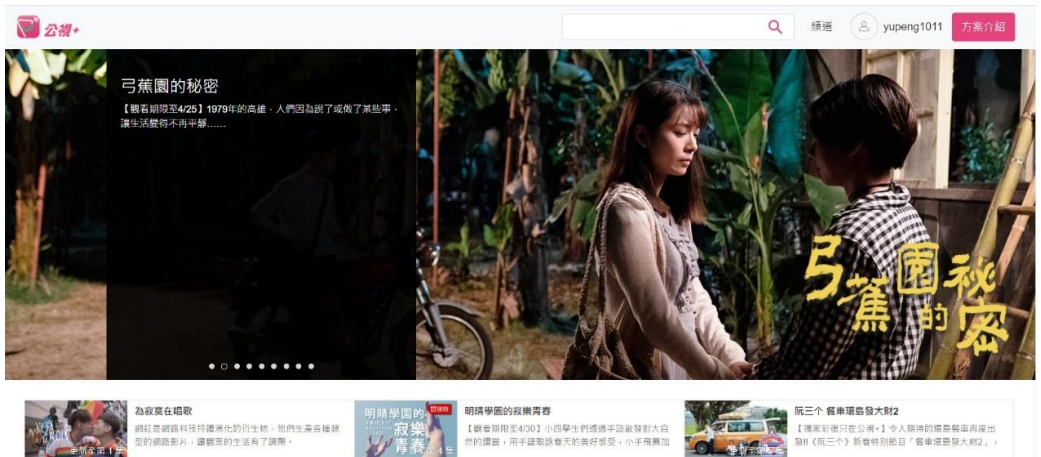
圖三：公視+ 的電腦介面

排播，隔日播出，可以回看 7 天的服務。事實上，台灣的 OTT 市場在 2016 年已漸熱絡，2016 年甚至稱之為 OTT 元年（顏理謙，2016）；2017 年時，已有 15 家 OTT 平台業者，主要的訂閱者以年輕人為主（CASBAA, 2017）相較於這個趨勢，2017 年的尼爾森收視調顯示，公視的觀眾群年紀始終偏高，大概在 55 歲左右（Lee, 2018）。因此，一方面公視希望能因應年輕觀眾新的（網路）收視習慣，另一方面也因為市場的原故，公視+ 於 2017 年轉型升級為公視+ OTT 的服務，不限 7 天的收看期限，也加入過往節目，強調「地表最強串流影音服務和超過 800 小時影音」（圖二）另外除了能收看市場原有的標準（SD）與高畫質（HD）節目外，更支援超高畫質（4K）播映。就整體介面和播放品質來看，是合乎新媒體潮流的設計（如圖三和圖四）。接下來即針對《公視+》進行兩個主要面向分析：（一）串流平台的發展方向；（二）發行播映節目策展策略。