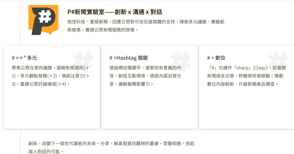
圖二：P#新聞實驗室的工作內容

2.P#新聞實驗室的定位與功能：依 2018 年 9 月 20 日第六屆第二十六次公視董事會之決議，新聞部規劃「台灣公廣新聞網建置三年計畫」，並於當年 12 月成立「公廣新聞網全媒體實驗平台」(簡稱「全媒體實驗平台」)，2019 年 5 月，全媒體實驗平台正式定名為「P#新聞實驗室」，專網也同時上線 12 ，以專題策展式新聞網站，提供每日新聞策展及數位敘事專輯，也經營社群媒體。「P#新聞實驗室」(以下簡稱實驗室)在官網上說明「#」的意義(如下圖)，「#」代表多元，也代表關鍵、數位，這些就是實驗室的工作內容。「以聚合公廣集團新聞資源為目標，採全媒體形式於多平台實驗，提供新一代的新聞資訊服務，啟動視網整合新聞數位轉型。」(受訪者 E)。