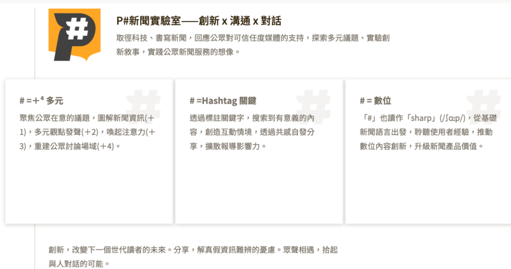
图二：P#新闻实验室的工作内容

2.P#新闻实验室的定位与功能：依2018年9月20日第六届第二十六次公视董事会之决议，新闻部规划「台湾公广新闻网建置三年计划」，并于当年12月成立「公广新闻网全媒体实验平台」（简称「全媒体实验平台」），2019年5月，全媒体实验平台正式定名为「P#新闻实验室」，专网也同时上线 12 ，以专题策展式新闻网站，提供每日新闻策展及数字叙事专辑，也经营社群媒体。「P#新闻实验室」（以下简称实验室）在官网上说明「#」的意义（如下图），「#」代表多元，也代表关键、数字，这些就是实验室的工作内容。「以聚合公广集团新闻资源为目标，采全媒体形式于多平台实验，提供新一代的新闻信息服务，启动视网整合新闻数字转型。」（受访者E）。