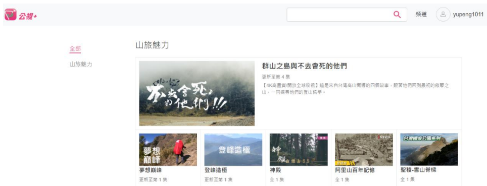
图五：「人为什么要爬山？」

主轴，搭配其他相关且曾经播出的纪录片或节目，如 2019 年柯金源导演的《神殿》纪录片，或是同样于 2019 年播出的台湾国家公园纪录片，这些「旧节目」不见得在主频道（电视频道）有随时播放的机会，但在这类策展式的安排下，会让观众和收视群更能清楚公视+策展的逻辑。至于后者，会因应「时事」（例如议题、得奖回顾或是和外部影展合作）而做出立即性策展，例如每年总是在金钟奖能获得众多奖项的戏剧节目，在金钟奖隔天后即会安排所有得奖相关节目上线。