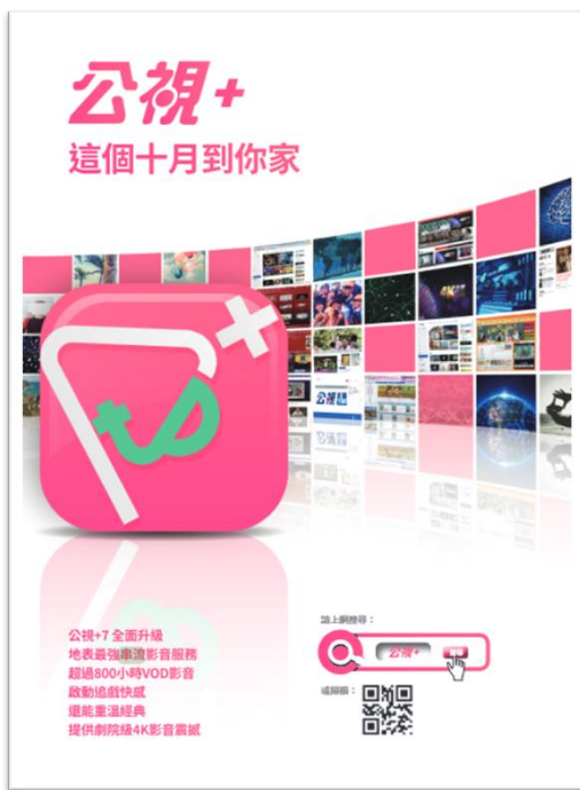
图二：《开镜》广告页面主打全新公视+影视平台服务上线的信息。

会精选一些内容在主频道播出，搭配客座编辑，算是串流媒体形式在公视播出的「基础原型」。